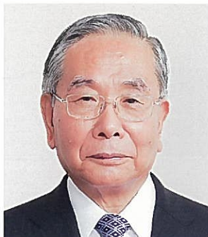
四国経済連合会 会長 (四国電力株式会社 会長)