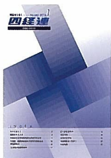
四経連会報（毎月発行）