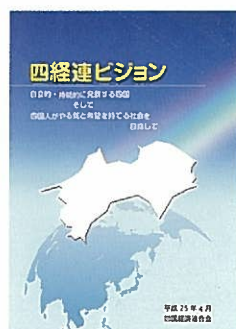
四国の自立的・持続的発展を目指した「四経連ビジョン」(H25年4月策定)