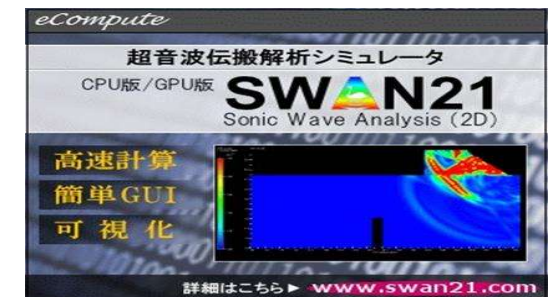
超音波伝搬シミュレーションソフト「SWAN21」