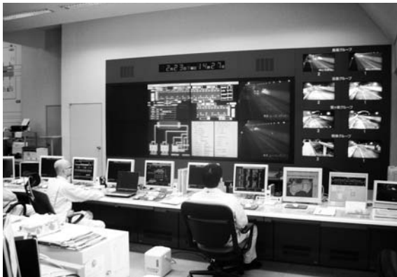
道路管制センター内の様子