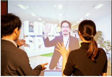
IOWNを活用した低遅延 コミュニケーション体験