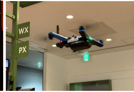
AIによるドローン映像解析