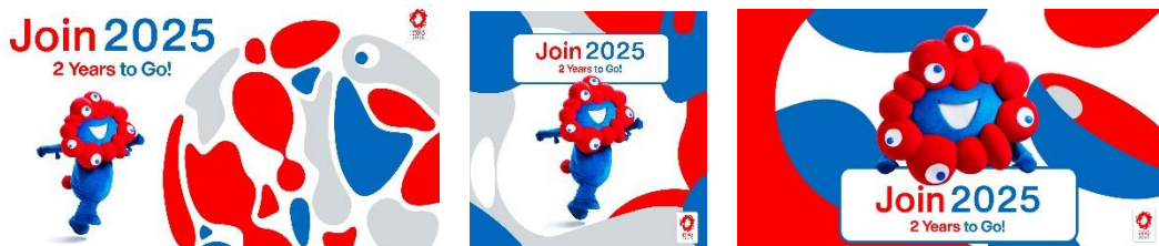
《ご提供する SNS ビジュアルの一例》

⑤協会アカウント及び貴団体等の公式アカウントの投稿記事への「いいね！」やリツイートなどのアクションをお願いします。