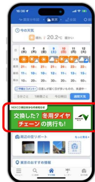
気象予測アプリバナー広告例

●テレビCM・ラジオCM・Web広告を通じて幅広く 冬道安全走行や 予防的通行止め を呼び掛け