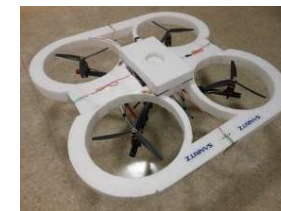
空中台車 試作1号機

UAV事業では、使用目的に応じた開発設計や調査・コンサルティング、ホビーから実用機まで弊社が開発したマルチコプターの販売が可能。自社オリジナルの機体を造りたいという要望にも対応可能。