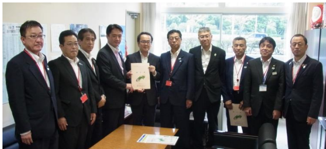
▲左から 枅富牟岐町長、横山安芸市長、杉本愛媛県土木部長、尾崎高知県知事、池田道路局長、佐伯四国経済連合会会長、海野徳島県副知事、清水愛南町長、片山香川県土木部長、花本上勝町長