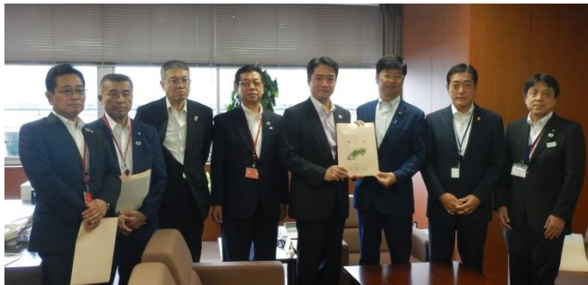
▲左から 横山安芸市長、清水愛南町長、海野徳島県副知事、佐伯四国経済連合会会長、尾崎高知県知事、阿達大臣政務官、中村愛媛県知事、片山香川県土木部長